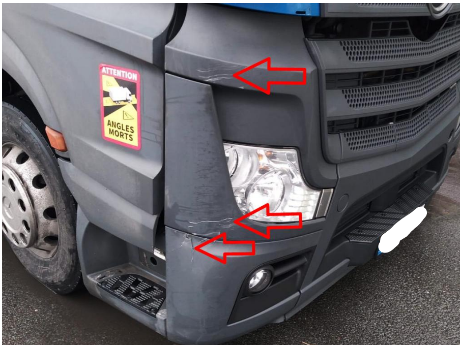
Scheinwerferabdeckung rechts innen und außen verkratzt mit Materialabtrag, Stoßfängerabdeckung rechts außen gebrochen