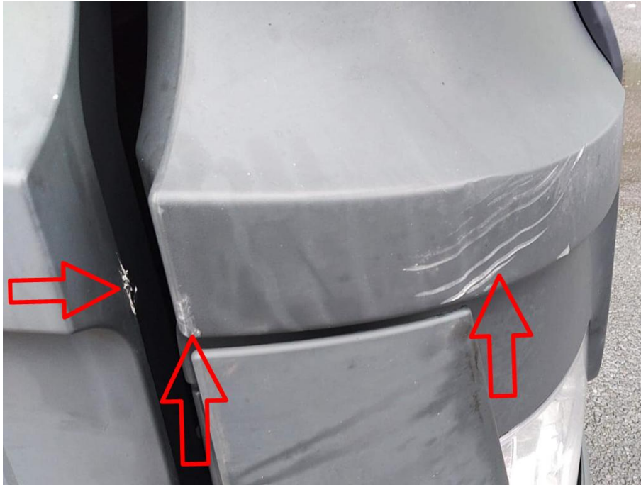
Scheinwerferabdeckung rechts innen und Türverlängerung verkratzt mit Materialabtrag