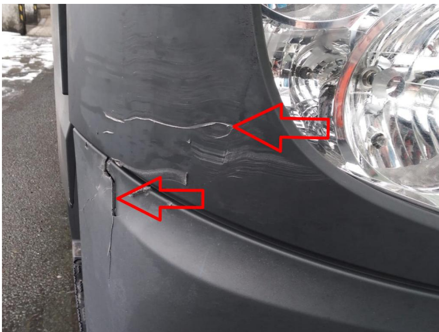
Scheinwerferabdeckung rechts außen verkratzt mit Materialabtrag, Stoßfängerabdeckung rechts außen gebrochen