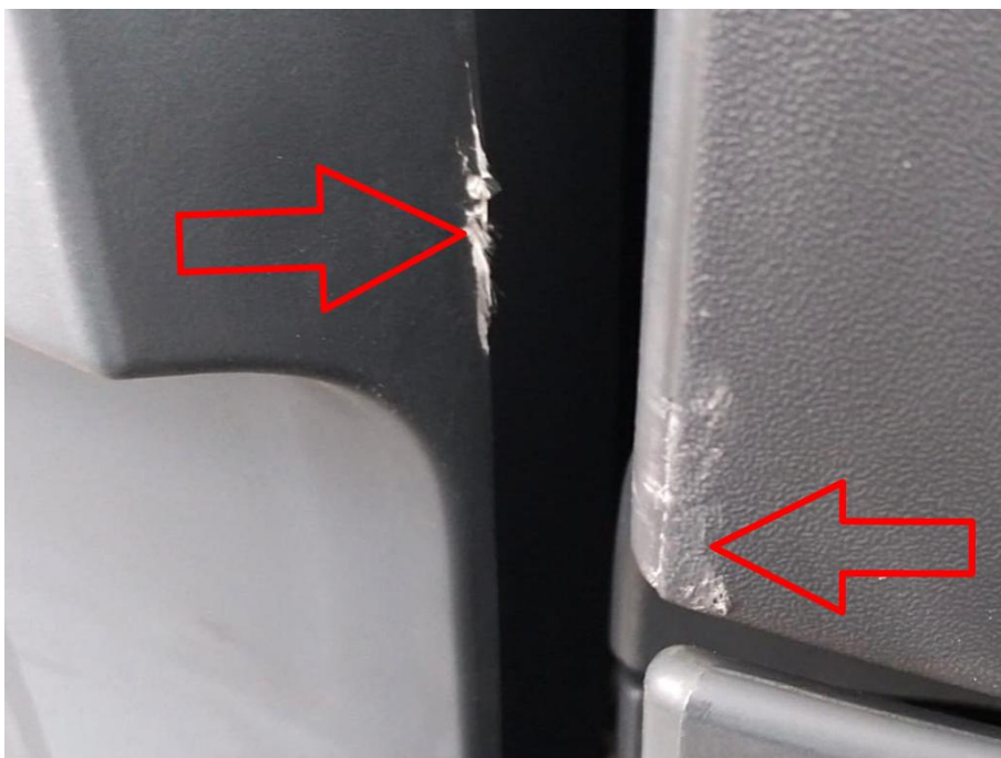
Scheinwerferabdeckung rechts innen und Türverlängerung verkratzt mit Materialabtrag