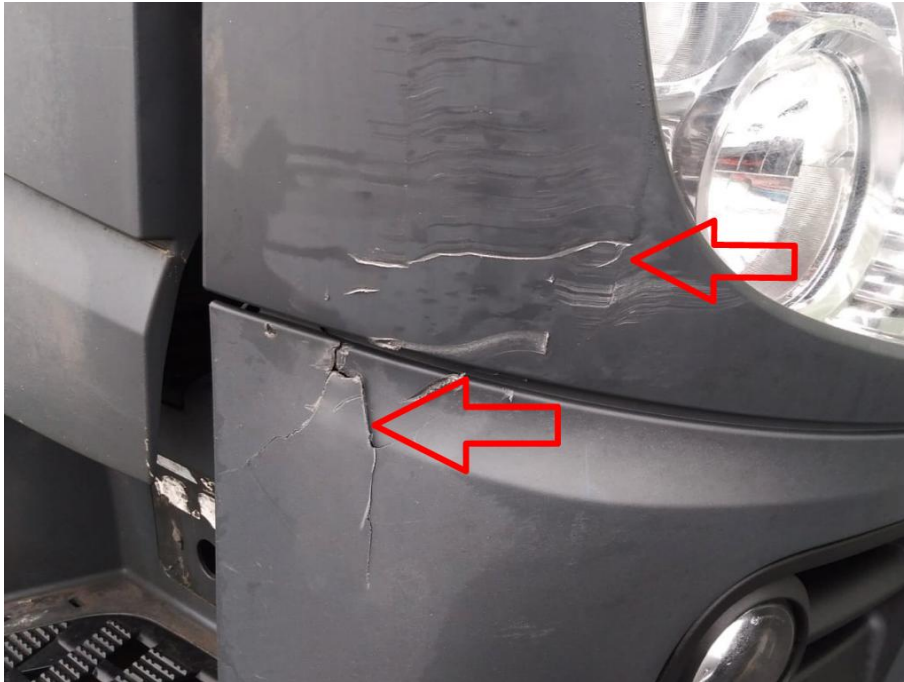
Scheinwerferabdeckung rechts außen verkratzt mit Materialabtrag, Stoßfängerabdeckung rechts außen gebrochen