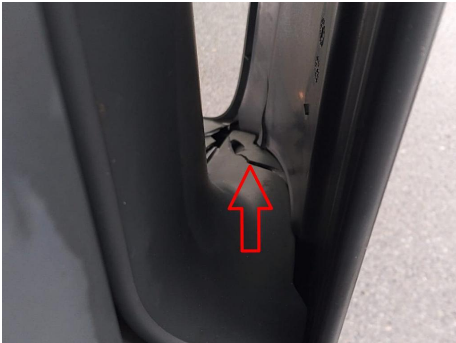
Scheinwerferabdeckung rechts außen unfallbedingt gebrochen