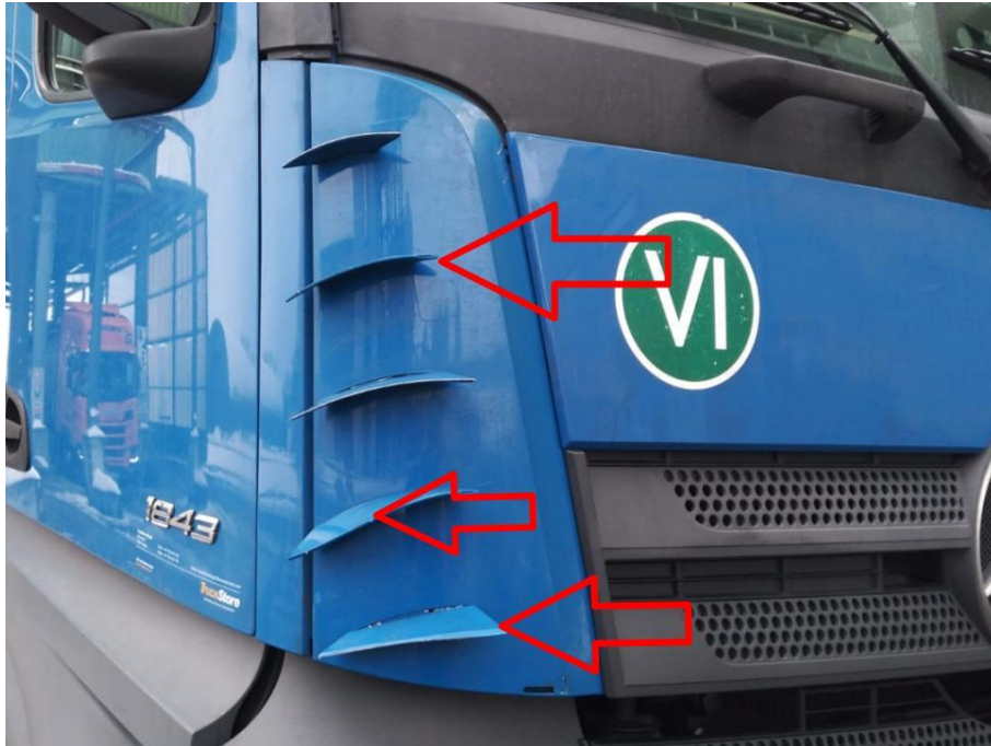
Luftführung rechts an der Frontklappe unfallbedingt abgerissen, Luftführungselemente an der unterliegenden Abdeckung verformt