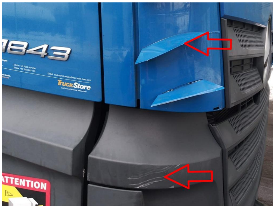
Luftführung rechts an der Frontklappe unfallbedingt abgerissen, Scheinwerferabdeckung rechts innen verkratzt mit Materialabtrag