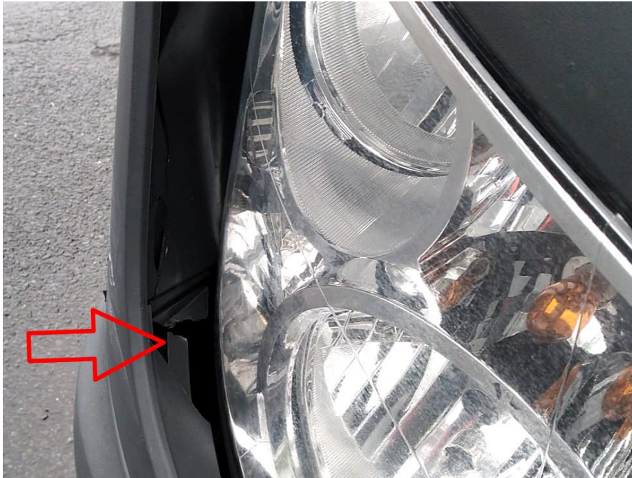
Scheinwerferabdeckung rechts außen unfallbedingt gebrochen