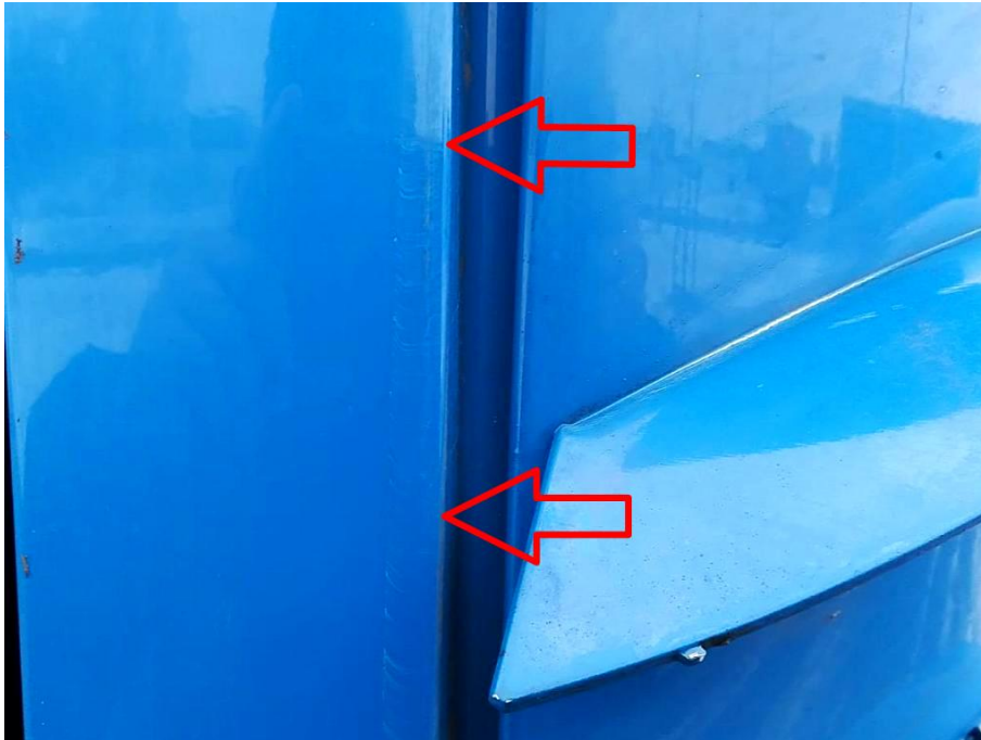
Abdeckung der Vorbauklappe rechts unfallbedingt verschrammt/verkratzt